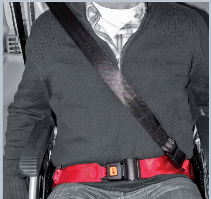
Der Beckengurt (rot) ist fester Bestandteil des Kraftknotens. Der Schulterschräggurt (schwarz) ist im KMP/Kfz montiert.

Der vorliegende AMF-Bruns Kraftknotenadapter ist in Anlehnung an DIN 75078-2 / ISO 10542 getestet. Der Rollstuhltest nach ISO 7176-19 obliegt dem Rollstuhlhersteller.