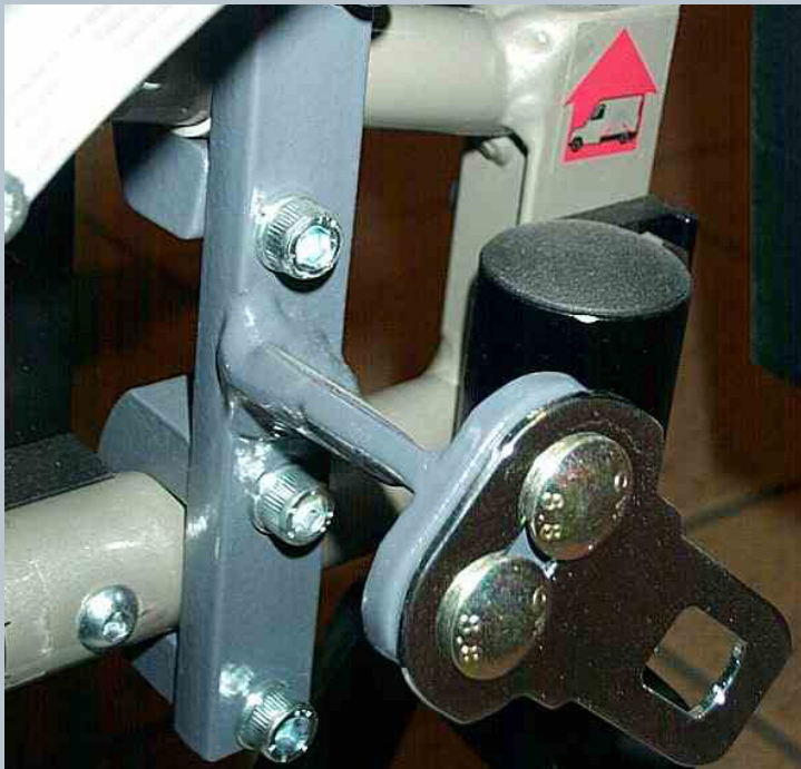
Zwei vordere Kraftknotensysteme mit jeweils einer Schwerlastöse für Spannretractor oder Statikgurt.