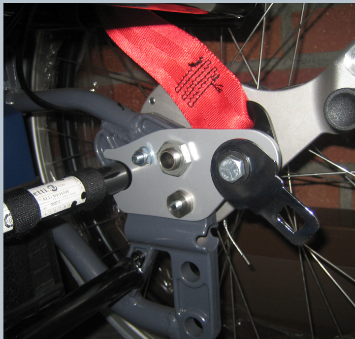
Zwei hintere Kraftknotensysteme mit jeweils einer genormten Schwerlastöse für Spannretractor. Der Beckengurt ist bereits fest montiert.