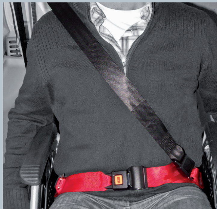
Der Beckengurt (rot) ist fester Bestandteil des Kraftknotens. Der Schultersträggurt (schwarz) ist im KMP/Kfz montiert.

Der vorliegende AMF-Bruns Kraftknotenadapter ist in Anlehnung an DIN 75078-2 / ISO 10542 getestet. Der Rollstuhltest nach ISO 7176-19 obliegt dem Rollstuhlhersteller.